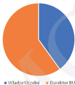
Rycina 3. Podległość służbowa bibliotekarzy biorących udział w ewaluacji.

W zakresie wsparcia uczelni przez pracowników konkretnego działu biblioteki (lub utworzenia nowego na potrzeby ewaluacji) okazało się, że wiodącą rolę odgrywają działy informacji naukowej; taka sytuacja ma miejsce w aż 13 spośród 18 badanych jednostek.