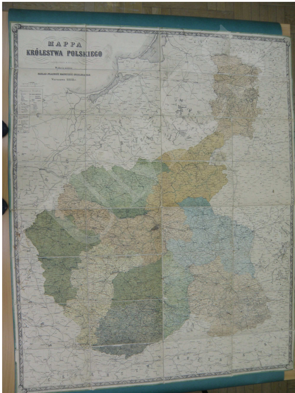
Fot. 2. Mapa Królestwa Polskiego ułożona przez M. Nipanicza