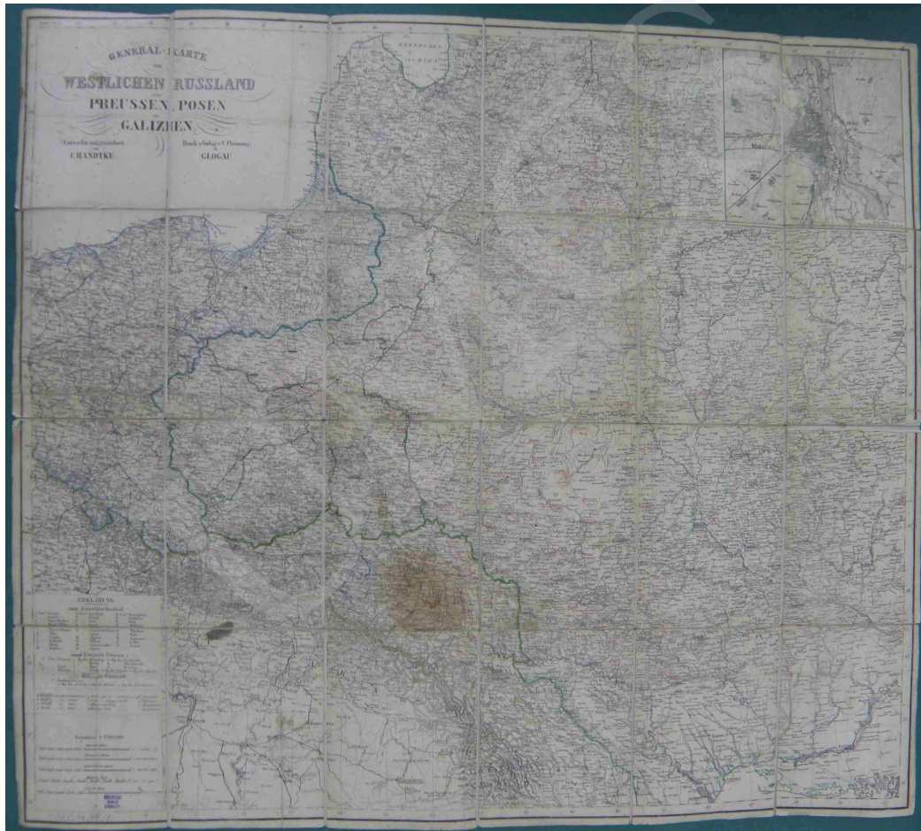
Fot. 14. General-Karte vom Westlichen Russland nebst Preussen, Posen und Galizien entworfen und gezeichnet von F. Handtke

Na mapie (fot. 14) rzeźba terenu została przedstawiona za pomocą metody kreskowej, granice zaś oznaczono kolorami. W lewym dolnym rogu umieszczono legendę oraz skalę liczbową i 5 podziałek liniowych. Dodatkowo, w prawym górnym rogu, widnieje mapa okolic Warszawy w skali ok. 1: 90 000. Mapa jest podklejona na płótnie i umieszczona w ramce.