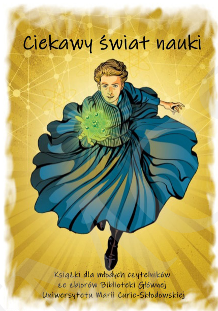
Fot. 1. Plakat reklamujący wystawę, autorstwa I. Mielniczuk i M. Zawady, zamieszczony na witrynie internetowej BG UMCS oraz ustawiony na wejściu przed wystawą.

Książki zaprezentowano na stołach i mobilnych ekspozytorach w kilku blokach tematycznych, np. astronomia, medycyna, historia itp. Przy każdym przygotowano tablice z ciekawymi informacjami oraz postaciami ze świata nauki. Uzupełnieniem prezentowanych pozycji książkowych był stary sprzęt techniczny w postaci dwóch telefonów tarczowych oraz maszyn do pisania. Dla odwiedzających przygotowano strefę relaksu, w której można było odpocząć i poczytać. Obok znajdował się kącik plastyczny, w którym najmłodszy odwiedzający mieli możliwość uwiecznienia wrażeń z wystawy. Pozostawione przez nich dzieła były prezentowane na specjalnej tablicy umieszczonej obok wystawy.