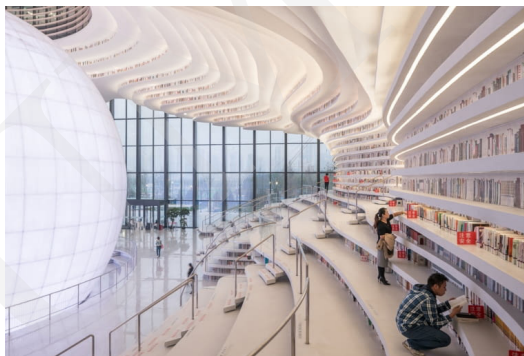
Fot. 11. Biblioteka Binhai w Tianjin, fot. Ossip van Duivenbode. Źródło: https://www.bryla.pl/bryla/7,85298,22639247,futurystyczna-biblioteka-w-chinach-od-mvr-dv.html .

Przykłady te pokazują, jak bardzo innowacyjne potrafią być budynki biblioteczne łączące funkcjonalną architekturę, estetykę i zaawansowaną technologię. Widoczne jest tworzenie miejsc przyjaznych czytelnikowi, sprzyjających nauce i integracji społecznej. Biblioteki tym samym odpowiadają na zmieniające się potrzeby społeczeństwa i rozwój technologiczny.