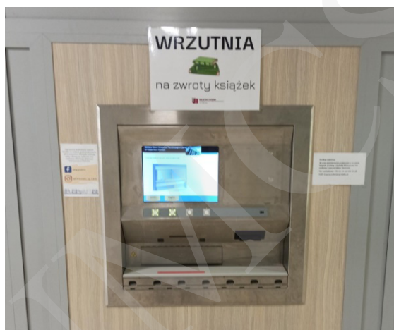
Fot. 12. Wrzutnia Biblioteki Uniwersytetu Przyrodniczego w Lublinie.

większej ilości informacji niż przy tradycyjnych kodach. Etykiety RFID umożliwiają odczytanie danych bez konieczności ściągnięcia książki z regału, lokalizują źle odłożone egzemplarze oraz zabezpieczają przed kradzieżą. System automatycznej identyfikacji RFID zapewnia szybsze i wydajniejsze zarządzanie zbiorami bibliotecznymi.