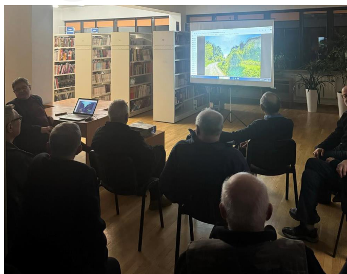
Fot. 5. Wykład Stowarzyszenia Miłośników Dawnej Broni i Barwy.