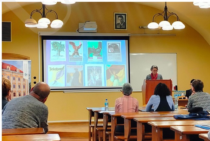
Fot. 2. Prezentacja jednego z wystąpień.