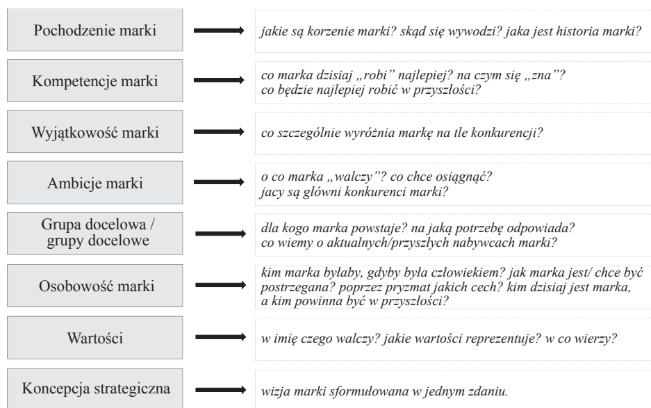
Rysunek 1. Brand Foundations – strategia marki wg firmy Corporate Profiles Consulting