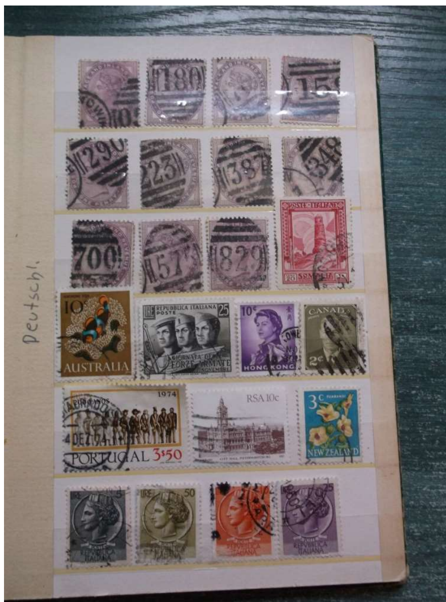
Fot. 3. Jedna ze stron

z różnych krajów świata. Belgia sąsiaduje z Indiami, Argentyna leży obok Szwajcarii, gdzie indziej Włochy, Chile oraz Szwecja, Turcja i Kanada. Ta specyficzna topografia czyni z albumu niepowtarzalny przedmiot i miejsce swoiste. Staje się on też szczególnym odwzorowaniem świata.