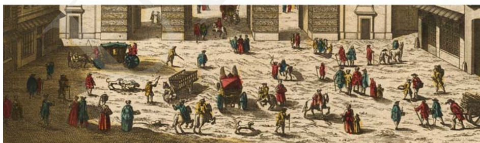
Ilustracja 10. Widok Paryża, brama Saint Martin, vue d'optique 31x45 cm, ok. 1760.

Kolejny efekt pozorowania przestrzenności grafiki przez zograscope związany jest z powszechną praktyką podkolorowywania vue d'optique , co nie jest zabiegiem czysto ornamentalnym. Powstaje dzięki temu efekt chromostereopsis – wrażenie głębi przestrzennej osiągnięte w dwuwymiarowych obrazach, na skutek zestawiania ze sobą kolorów odległych na skali „temperaturowej” barw 15 . Relatywne różnice temperatury barw przekładane są na wrażenie dystansu do oka obserwatora. Szczególnie aktywnie działają w tym kierunku skrajne zestawienia: czerwony – niebieski,