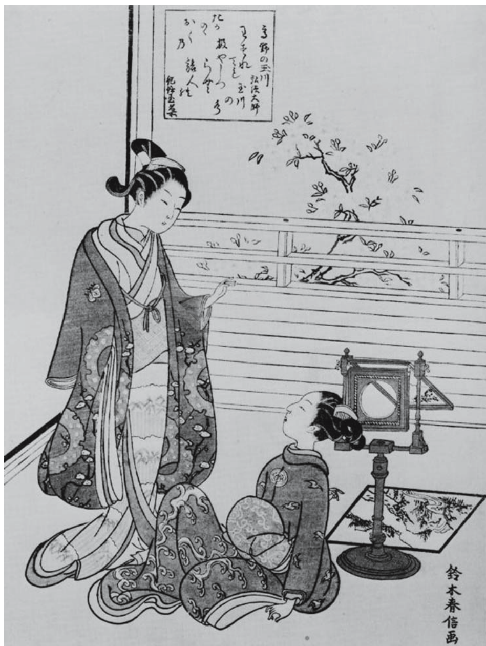
Ilustracja 11. Suzuki Harunobu (1725?-1770), Dwie piękne dziewczyny z zograscopes , drzeworyt koniec lat 1760(?).