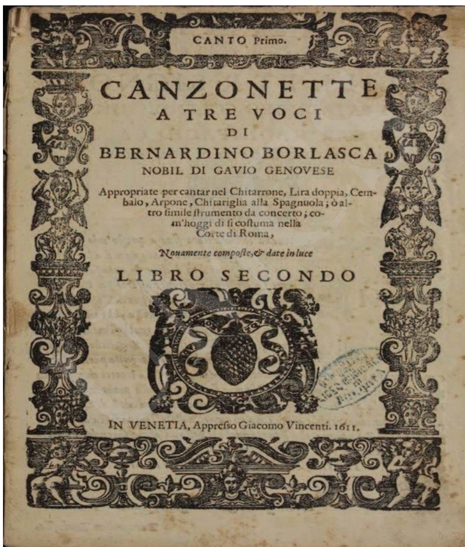
Ilustracja 4. Bernardino Borlasca, Canzonette , I-Bc, sygn. X. 140.