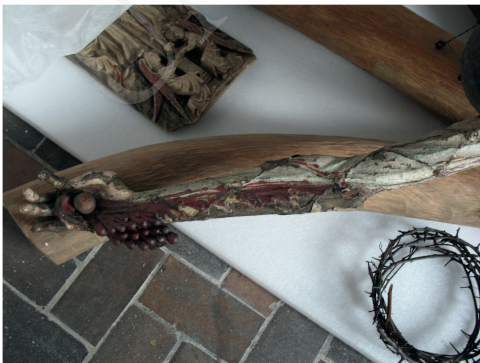
Ilustracja 2. Krucyfiks z kościoła Bożego Ciała we Wrocławiu, Ekspozycja Galerii Sztuki Średniowiecznej w Muzeum Narodowym w Warszawie.