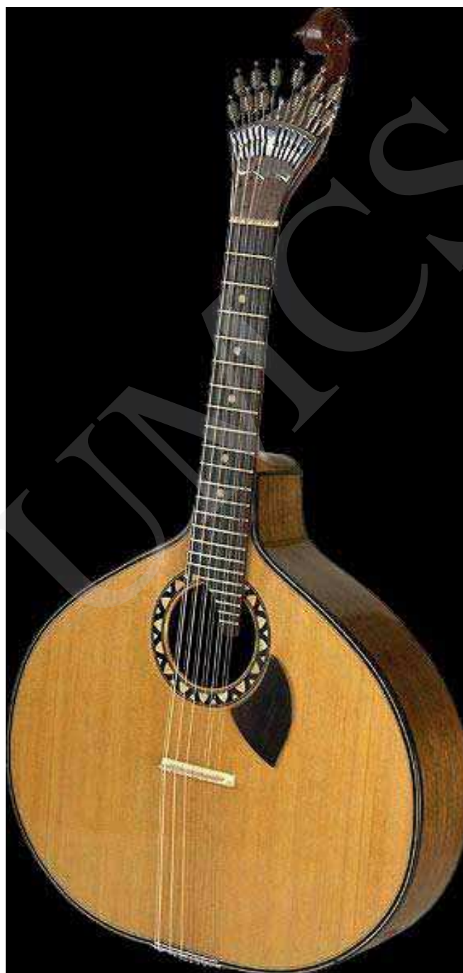
Ilustracja 2. Gitara portugalska, cyt. [za:] www.pinterest.co.uk/yvanroyen/fado [data dostępu: 02.01.2018].