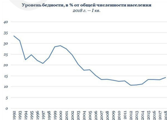
Таблица 1. Динамика уровня бедности в России (1992–2018 г.г.)